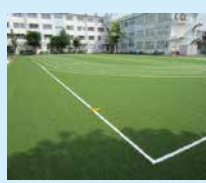
西小岩小 小学校初的人工芝化